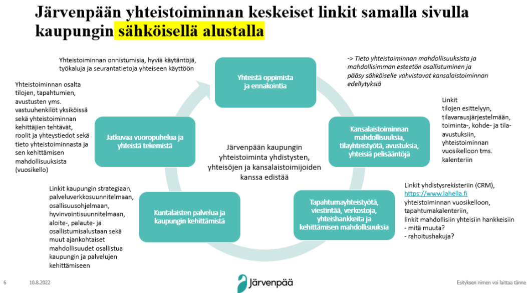
Kuva 5. Yhteistoiminnan kokonaisuuden koonti sähköiselle alustalle yhdelle sivulle