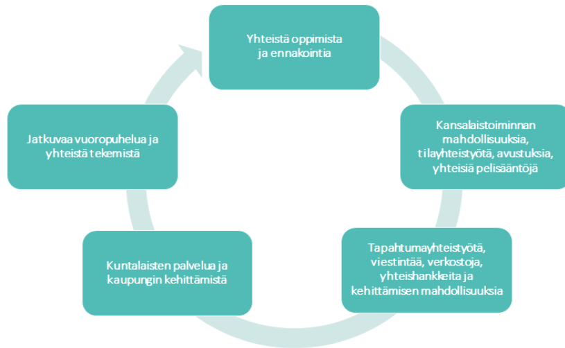
Kuva 1. Järvenpään yhteistoiminta yhdistysten, yhteisöjen, kansalaistoimijoiden ja kaupungin kanssa hyvän kertymisen kehällä